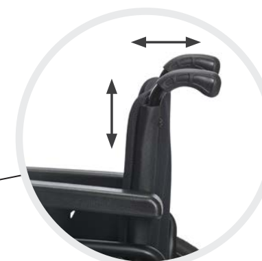
Teleskopier- und winkeleinstellbare Rückenhöhen von 350–410 mm bzw. 400–460 mm für die ideale Anpassung an sich verändernde Krankheitsbilder