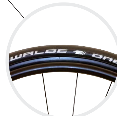
Schwalbe ONE Bereifung, profillos, pannengeschützt und leicht