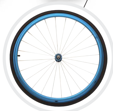
Aktiv-Rad mit Radialspeichen, Schwalbe ONE Bereifung, Nabe, Felge, Greifreifen farbige in blau, rot, gelb für mehr Individualisierung