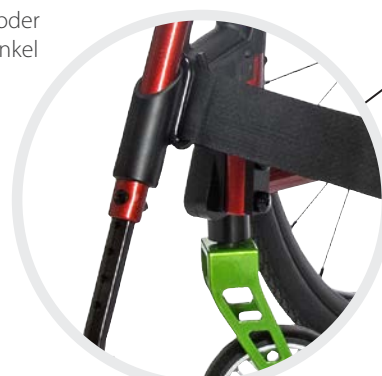
Stufen oder stufenlose Einstellung der Unterschenkelhöhe an persönliche Bedürfnisse anpassbar, auch verkürzte Unterschenkelhöhe von 290–390 mm möglich