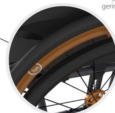
Curve GEKKO, Aluminium schwarz eloxiert mit wechselbarer Gummilippe, ergonomisches Greifreifenprofil, ideal für Tetraplegiker