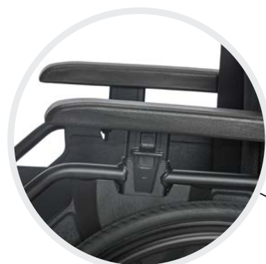
Höhenverstellbares Seitenteil mit Einhandbedienung