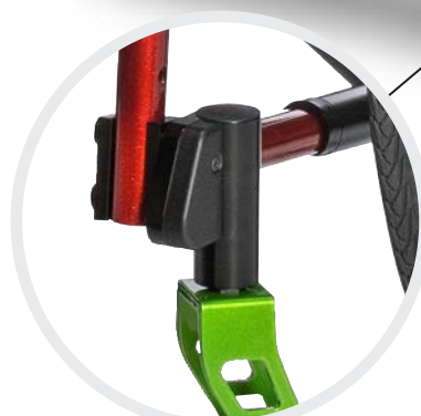
Bis zu 12° Sitzneigung für feinstufige Anpassungsmöglichkeiten