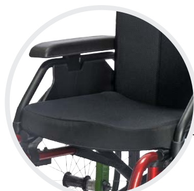
Sitzbreiten in 420 mm und 440 mm