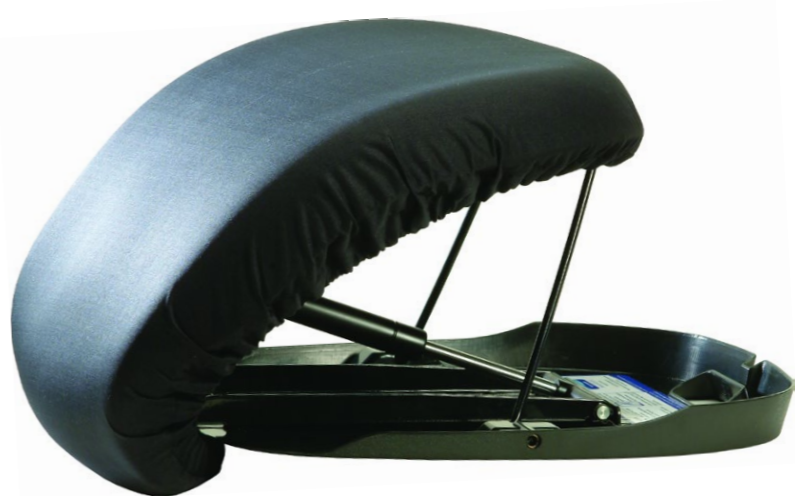
Asiento catapulta Uplift