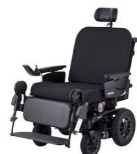
iCHAIR XXL 1.614 PÁGINA 4