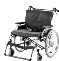
EUROCHAIR² XXL 2.850 PÁGINA 3