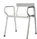
TABURETE DE DUCHA CON REPOSA-BRAZOS XXL PÁGINA 9