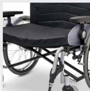
Erhöhte Stabilität durch Verwendung einer Doppelschere